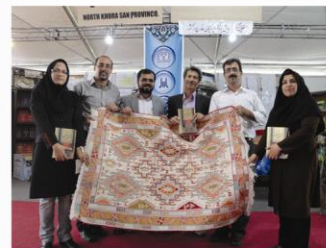
رتبه برتر نمایشگاه بین المللی تهران سال ۸۹