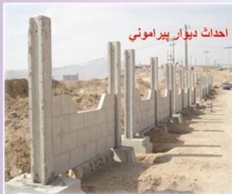
احداث دیوار پیرامونی