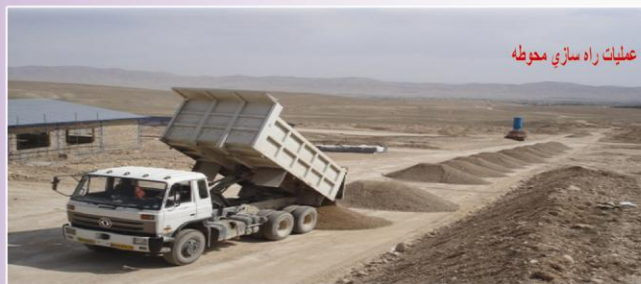
عملیات راه سازی محوطه