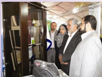
بازدید استاندار خراسان شمالی از غرفه دانشگاه در نمایشگاه ایرانیان خارج از کشور