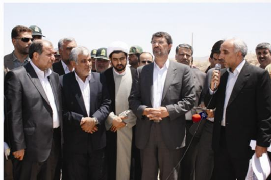
کلنگ زنی سازمان مرکزی با حضور وزیر محترم کشور آقای دکتر نجار