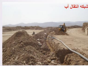
شبکه انتقال آب