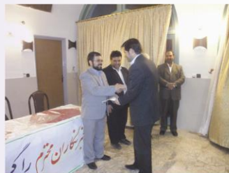
تقدیر از خبرنگاران استان - روز خبر نگار سال ۱۳۸۹