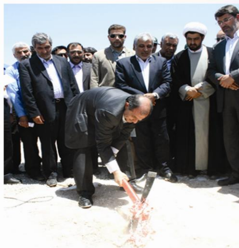
کلنگ زنی سازمان مرکزی با حضور وزیر محترم کشور آقای دکتر نجار