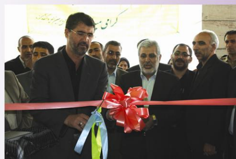
افتتاح ساختمان شماره ۱ دانشکده علوم انسانی با حضور مسئولین استانی