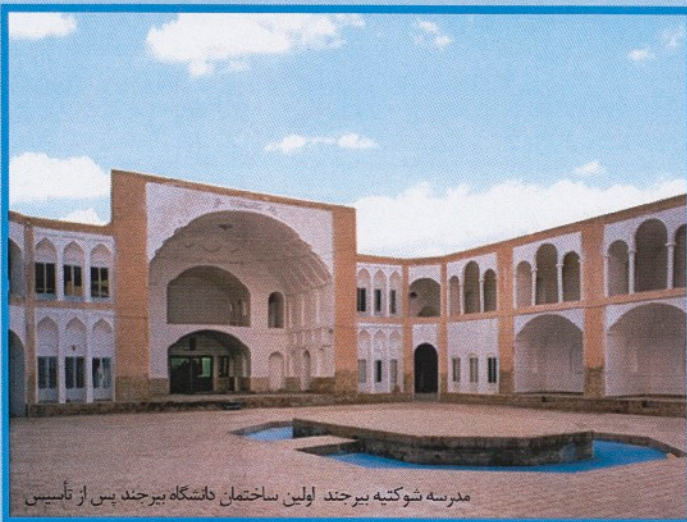
مدرسه شوکتیه بیرجند اولین ساختمان دانشگاه بیرجند پس از تأسیس

آغاز تأسیس دانشگاه بیرجند به سال ۱۳۵۴ بر می گردد. در سیزدهم خرداد ماه این سال شورای گسترش آموزش عالی در یکصد و دومین نشست خود با تأسیس مؤسسه آموزش عالی در بیرجند موافقت نمود. در مهرماه همان سال دکتر محمدحسن گنجی به عنوان اولین رئیس این مؤسسه مأمور فراهم ساختن مقدمات تأسیس دانشگاه شد. فعالیت آموزشی و علمی دانشگاه بیرجند از سال ۱۳۵۶ با پذیرش ۱۲۰ دانشجو در سه رشته شیمی، ریاضی و فیزیک در مقطع کارشناسی آغاز شد. پس از پیروزی انقلاب اسلامی به مجتمع آموزش عالی تغییر نام یافت و به تدریج مراحل رشد و شکوفایی خود را با سرعت بیشتری ادامه داد. در سال ۱۳۶۸ به مجتمع دانشگاهی تبدیل شد تا اینکه به لحاظ موقعیت شایسته علمی در اسفند ماه سال ۱۳۷۱ به دانشگاه بیرجند ارتقاء یافت.